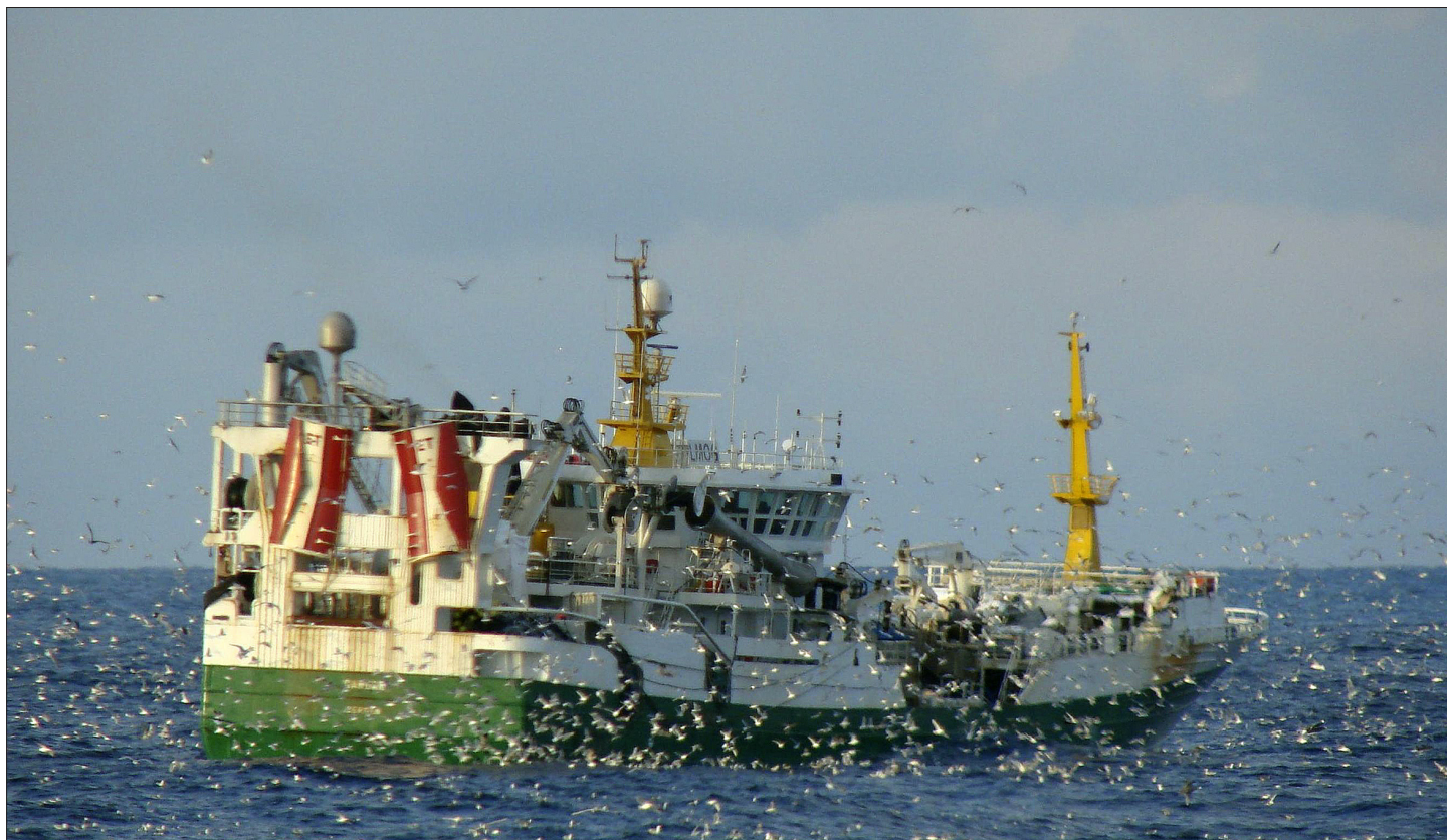
Ringnotsnurperen "Gardar" på loddefeltet. Den største delen av loddekvota fiskes med ringnot.

Lodda er en nøkkelbestand i økosystemet i Barentshavet, og inngår i dietten til både torsk, hyse, sild og sel. Loddebestandens størrelse kan variere mye som følge av beitepress og fiske, og siden lodda dør etter gyting. Samtidig har lodda stor fangstverdi og finner veien til mange godt betalende marked.